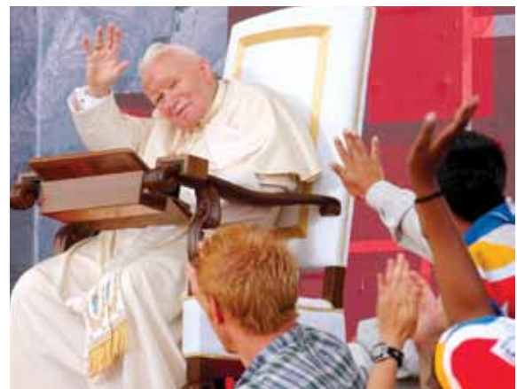
Photo du Pape Jean-Paul II lors des JMJ à Toronto en 2002

« Cette évangélisation doit être faite par un usage compétent et professionnel de la radio, de la télévision, et des médias audiovisuels. Et à l'évangélisation sont nécessairement liés l'amélioration de toute la race humaine, le développement intégral des hommes et des femmes du monde entier. C'est un but noble et profondément chrétien et le Pape partage votre conviction qu'il ne pourra être dignement servi que par un professionnalisme qui n'admet rien qui n'ait été soigneusement préparé. Cela est certainement requis par le respect dû à la Parole de Dieu et par celui auquel les téléspectateurs ont droit. »