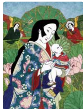
Notre-Dame du Sacré Coeur, Japon