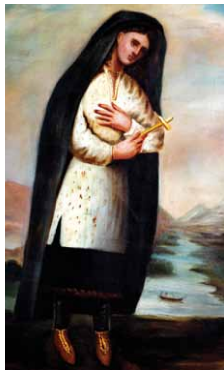
[Photo] Bienheureuse Kateri tenant une croix. Tableau peint par le père jésuite Claude Chauchetière, qui a personnellement connu la bienheureuse Kateri.

Les derniers mois de sa vie furent une manifestation encore plus claire de sa foi très solide, de sa franche humilité, de sa calme résignation et de sa joie radieuse, même au milieu de terribles souffrances. Ses derniers mots, simples et sublimes, murmurés au moment de sa mort, résumèrent, tel un noble hymne, une vie empreinte de charité pure : « Jésus, je