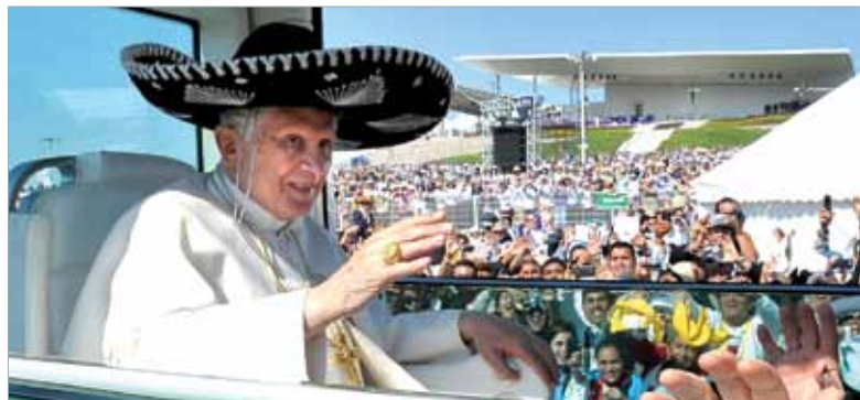
Le Saint-Père Benoît XVI en sombrero lors de son arrivée à Silao au Mexique, le 25 mars 2012

Bilan des activités de Sel et Lumière rendues possibles grâce à la générosité de nos donateurs / donatrices