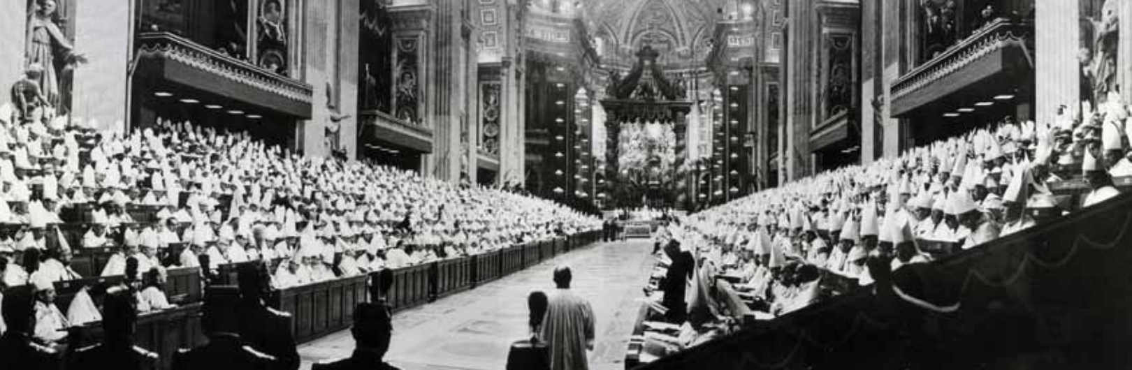
[Photo] Vue panoramique des évêques dans la nef de la basilique St-Pierre durant la session d'ouverture du concile Vatican II, 11 octobre 1962 © CNS photo