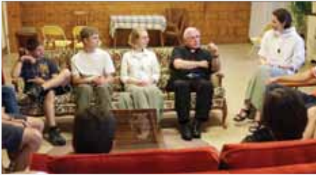
[Photo] Concile des jeunes – Famille Marie-Jeunesse à Sherbrooke, juin 2012

L'ANNÉE 2012 a été particulièrement riche en événements jeunesse au Québec. J'ai eu la chance de réaliser des émissions sur ces temps forts dans les diocèses de Montréal, Saint-Jean-Longueuil et Sherbrooke.