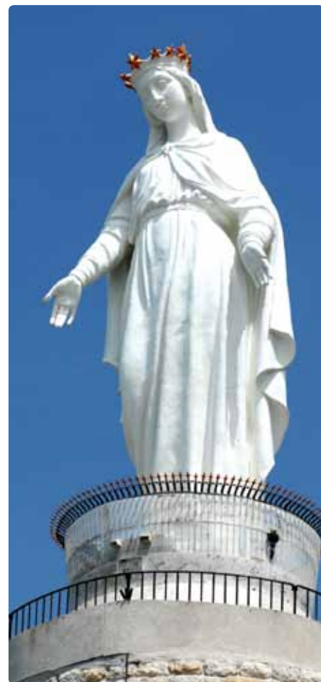
Notre-Dame du Liban, Harissa – Mont Liban

Aujourd'hui, plusieurs églises portant le nom de Notre-Dame du Liban vénèrent la Vierge Marie partout au Canada et dans le monde.