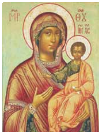
La Très Sainte Mère de Dieu (Russie)