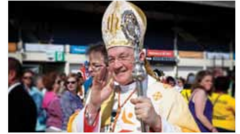
[Photo] Le cardinal Marc Ouellet, Préfet de la Congrégation des évêques, légat papal au Congrès eucharistique international de Dublin 2012.

LE CONGRÈS EUCHARISTIQUE INTERNATIONAL de Dublin fut certainement un événement phare pour l'Église catholique en Irlande, ainsi que pour tous les pèlerins qui y ont participé. L'histoire, les paysages ainsi que l'accueil irlandais ne pouvaient faire autrement que de plonger les participants dans une atmosphère à la fois spirituelle et fraternelle.