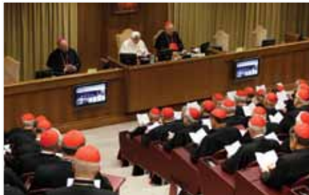
[Photo] Benoît XVI assisté par le cardinal-désigné Dolan et le cardinal Sodano lors de la réunion des cardinaux, le 17 février 2012

Cette forme spécifique de transmission de la foi s'adresse tout particulièrement aux pays, comme le Canada, où la riche tradition chrétienne a été présente, mais tend de plus en plus à s'effacer à la fois, de la vie des personnes et de la vie civile en général. Ce phénomène est généralement