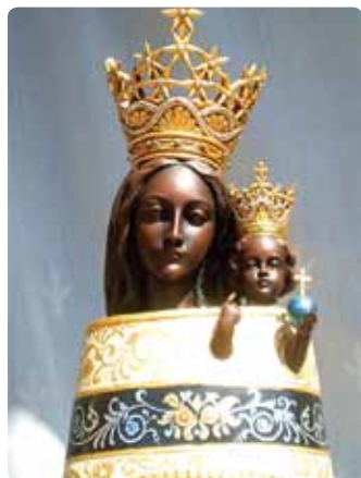
Notre-Dame du Loreto (Nazareth)