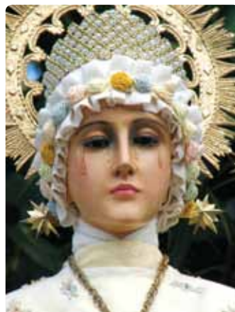
Notre-Dame de La Salette (France)